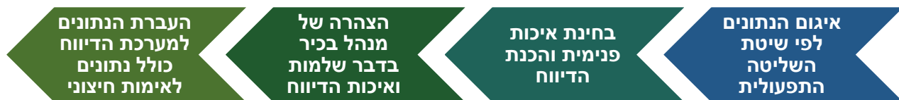
איור 2 - שלבי הסיכום והדיווח של מצאי הפליטות

תהליך הסיכום והדיווח של מצאי הפליטות המומלץ עבור מערך הדיווח בישראל כולל את השלבים הבאים, כפי שמתואר באיור 2: