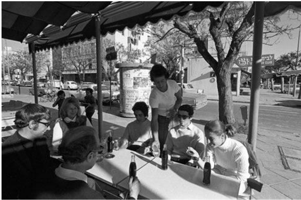
בית קפה בנתניה בשנות ה-60. עד היום, יש פער גדול בין ערים שהוקמו לפני ואחרי מלחמת העצמאות