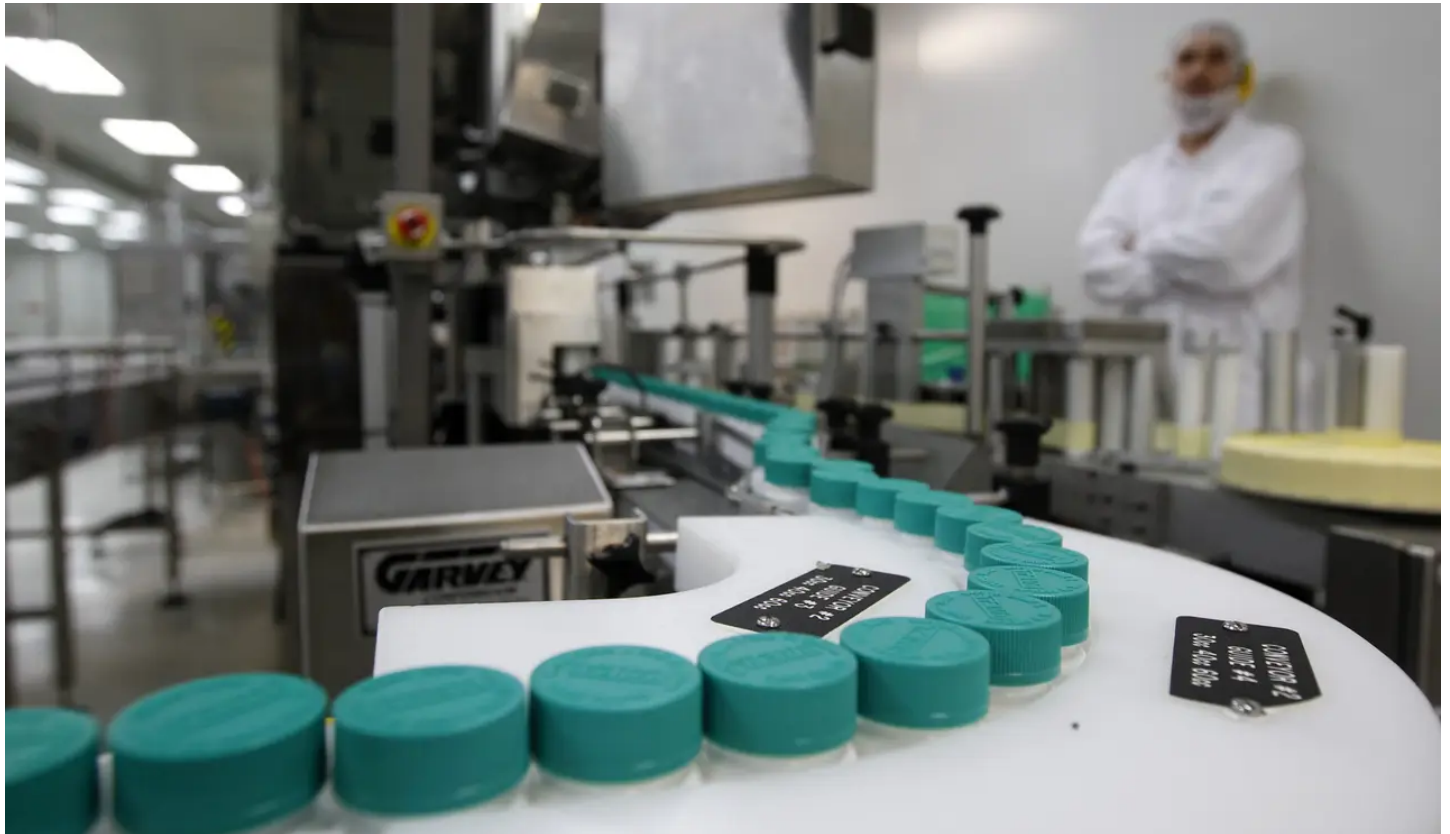
מפעל טבע