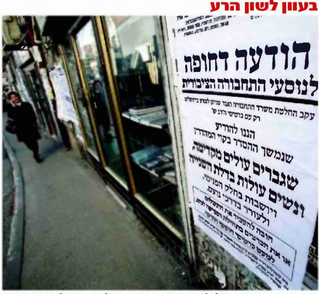
פתרון מהתחום הפלילי אינו חכם. פשקוויל הקורא להדרת נשים

ביום שני השבוע התכנסה הנהלת הקואליציה לרון בחוק הסדרת המאחזים של ח"כ זבולון אורלב, כשבאמתחתה החלטה משבוע שעבר שקבעה כי חברי הקואליציה ידונו בשאלה האם לאפשר חופש הצבעה לחברי הקואליציה בהצבעה על הצעת החוק. יו"ר הקואליציה ח"כ זאב אלקין לא השתתף בדיון השבוע, מאחר שבאותו הזמן שכב בביתו וקרה מחום. באתר ynet פורסם בשם "גורם בכיר בליכוד" כי מדובר בסוג של "שביתה איטלקית" של אלקין, שלמעשה מעביר מסר לראש הממשלה בעקבות התנגדות נתיניהו לחוק הסדרת המאחזים. אלקין, שקיבל הודאה ברורה מהדופא שלא לזוז מהבית במשך שבוע, הגיב בחריפות, ובעיקר לא אהב את העובדה שלא התבצעה בדיקה מולו לפני פרסום הדברים. וכך, בלי שבניית החוק התכוונו לכך, "הצליחו" לגרום לעוד חבר כנסת להצטרף לקבוצת התומכים בתיקון לחוק איסור לשון הרע (שמגדיל באופן משמעותי את סכומי הפיצויים ללא הוכחת נזק על הוצאת דיבה), שכזכור לא מצא חן בעיני רוב כלי התקשורת. אחד מהתיקונים שמייצגים יחמי החוק הוא החיוב בקבלת תגובה לפני פרסום ידיעה, כשאי פרסום התגובה יכול להגדיל באופן דרמטי את גובה הפיצוי הכספי. הצעת החוק, שכבר עברה בקריאה ראשונה, מחכה בוועדת החוקה לקראת הכנתה לקריאה שנייה ושלישית. אם בקרוב תעלה ההצעה מחדש לכותרות, לקראת אישורה הסופי, אל תבטלו את האפשרות שהאירוע הזה נתן להצעה דחיפה נוספת. ■