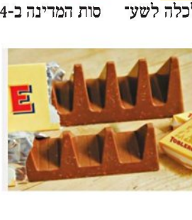
גודש תנועה, זיהום אוויר ומוצרים עתירי סוכר – האם מיסוי נוסף שלהם יכסה את החוב הלאומי? סמי פרץ 8

2 ביטול הפטור ממס על קרנות השתלמות, שיגדיל את הכנסות המדינה ב-6.4 מיליארד שקל.