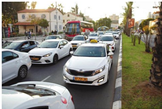
פקק תנועה בתל אביב. מיסוי השקול ל-12% מהתוצר

בצעם ישלם את מחיר המשבר: האם יהיו אלה העשירונים העליונים, שממילא נושאים כרוך נטל המס על הכנסה? המאיונים העליונים, שלא נזוקו מהמשבר ואולי אף התעשרו יותר? או אולי עשירוני הביניים, שם מרוכזים מרבית השכירים?