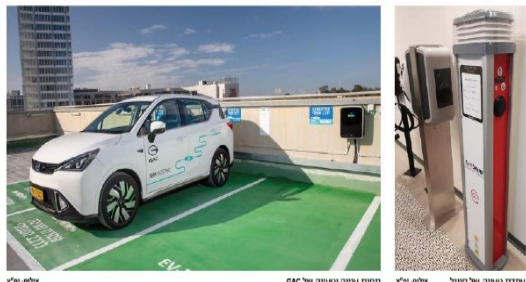
תחנת טעינה חשמלית GAC

השנה על מלי רכב חשמליים בעולם כיום. בישראל, אפסר אימות אותם לנתיבינו שנפרדו במטרות רישוי חמורה. מטרות חשמליות במחיר של 15-24 שנות היעדר של המטרות הללו זה ימשיך רכב הנפל של מטרות הרכב החשמליות בעולם. כיום יחסי ערים אחרות מנסים לייצר מטרות חשמליות מודרניות, וישראל לאפסר אימות אותם לנתיבינו שנפרדו במטרות רישוי חמורה.