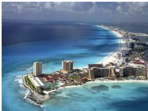
קנקון מקסיקו ממעון הציפור - גושי בנייה לתיירות לא ממש ירוקה

בסוף החודש, 29 בנובמבר יגיעו נציגים של כ-200 מדינות לקנקון, מקסיקו לקבל הכרעה בוועידת שינוי האקלים של האו"ם, שנה אחרי מה שמכונה בפי רבים "כישלון קופנהגן". מה מצפים שיקרה בוועידה ומה קרה בפועל במדינות המתועשות ובישראל במדינות המתועשות ובישראל? בן קופנהגן לקנקון?