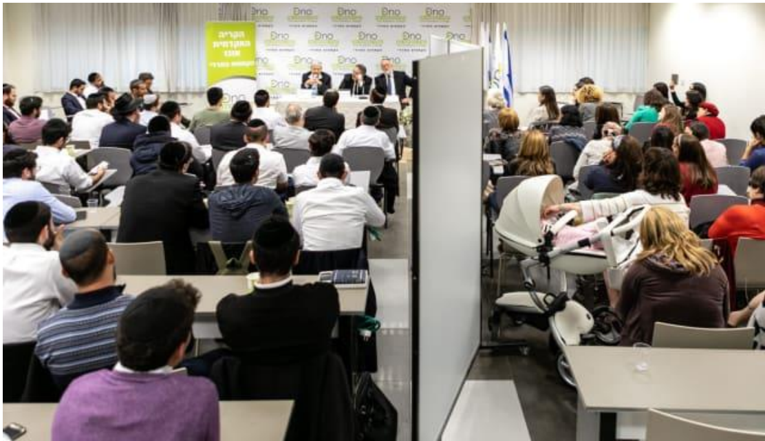
אהרון ברק בקריה אקדמית אונו

שאלת השתלבותם של החרדים בחברה הישראלית אינה מרפה והדיון הסוער בסוגיה מחייב להעמיד דברים על דיוקם. אירועים כמו הרצאתו באחרונה של השופט בדימוס אהרן ברק בפני סטודנטים חרדים, שבו הופרדו גברים ונשים על ידי מחיצה, או החלטת נציבות שירות המדינה לפתוח קורס צוערים לגברים חרדים בלבד, יצרו לא מעט קריאות ביקורת ומחאה מצד חילונים שחוששים, אולי שלא בצדק, בהעמקת "החרדיות".