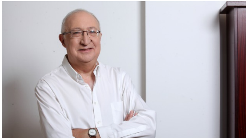
פרופ' מנואל טרכטנברג

לטרכטנברג, מבכירי הכלכלנים בישראל ששמו מוכר בכל בית מאז קיץ 2011, אז עמד בראש "ועדת טרכטנברג " שהמלצותיה המקיפות לשינוי סדר העדיפויות של הממשלה גרמו לסיום המחאה, ניסיון רב ביעוץ לממשלות ובהתוויית מדיניותן. בממשלת אולמרט כיהן כראש המועצה הלאומית לכלכלה וחברה, תפקיד אותו המשיך זמן מה גם בממשלת נתניהו.