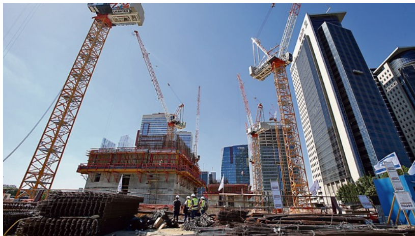
"שכונות נבנות כאן בזו אחר זו, צומחות לגובה ולרוחב תוך ניתוק גמור מצורכי התחבורה הציבורית". אילוסטרציה

"המדדים כשלעצמם לא משקפים תכנון לאומי מקיף ולא מבטיחים יעילות בביצוע. הסתכל על משבר התחבורה העמוק. שכונות נבנות כאן בזו אחר זו, צומחות לגובה ולרוחב תוך ניתוק גמור מצורכי התחבורה הציבורית. תושביהן פשוט נידונים להשתמש ברכב פרטי. מצב התחבורה הוא פשע תכנוני וביצועי".