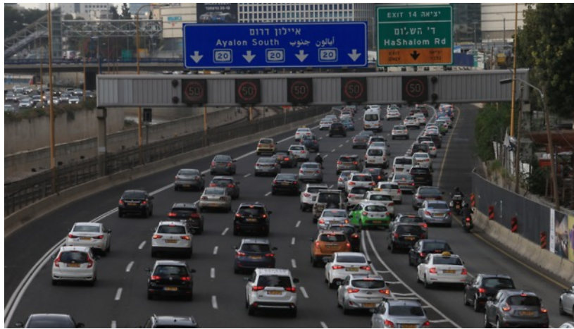
"מצב התחבורה הוא פשע תכנוני וביצועי". אילוסטרציה

פרופ' טרכטנברג קורא גם ל"בדק בית" בכל משרדי הממשלה, כדי לחשוף את מוקדי חוסר היעילות הרבים, החבויים מהעין. והוא לא מתכוון לטיפול בבירוקרטיה. "השימוש התכופ במילה בירוקרטיה לא מוביל לשום מקום. כולם נגדה, אז מה? אני מתכוון לבניית מנגנון מיוחד שייבחן כל הוצאה ובעיקר כל תקנה ורגולציה ממשלתית לפי מידת תועלתן ועלותן למשק הלאומי".