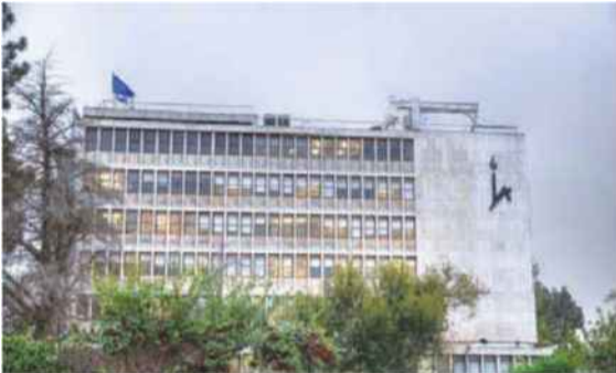
האוניברסיטה העברית בירושלים